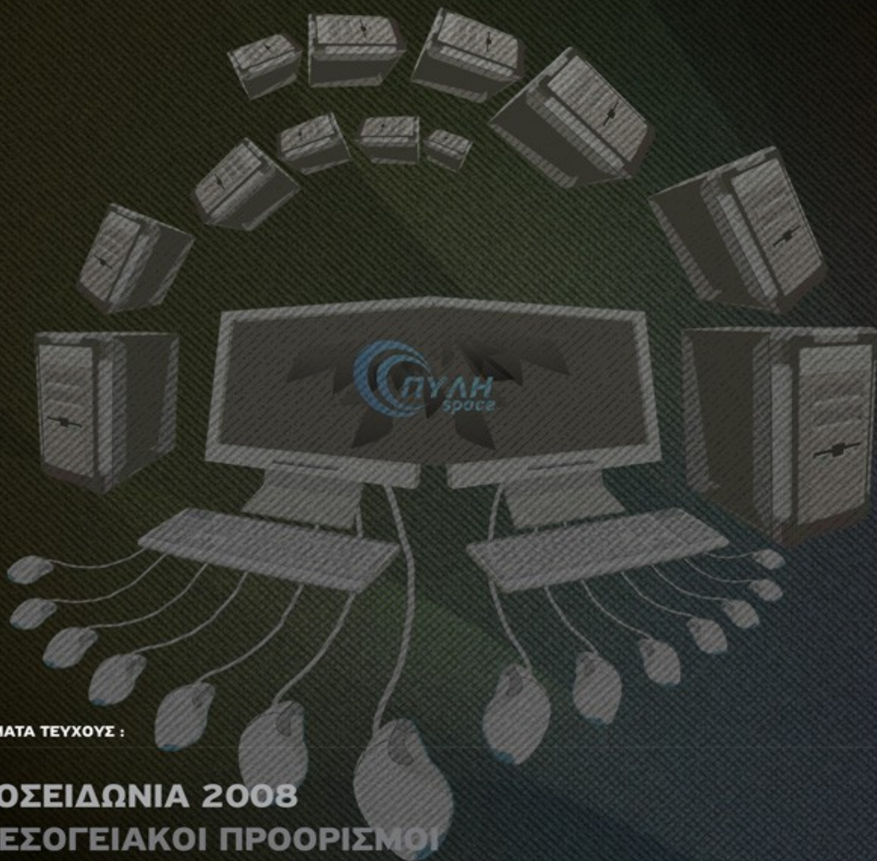
ILLUSTRATION BY UNUSUAL MINDS.GR

Ειδική έκδοση για το Τουριστικό πανόραμα 2008. www.pili-space.com